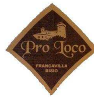
Pro Loco Francavilla Bisio