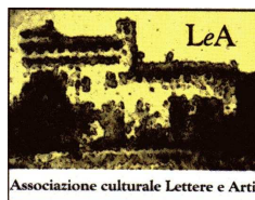
Associazione Lettere & Arti