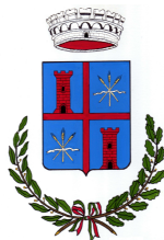
Comune di Francavilla Bisio