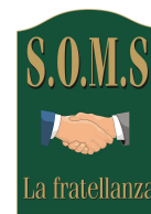
S.O.M.S. Francavilla Bisio