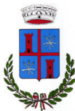
Comune di Francavilla Bisio