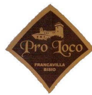
Pro Loco Francavilla Bisio