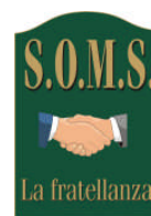
S.O.M.S. Francavilla Bisio