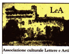
Associazione Lettere & Arti