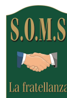
S.O.M.S. Francavilla Bisio