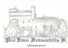
Pro Loco Francavilla Bisio