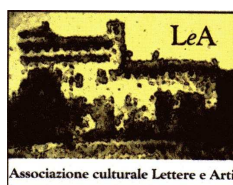
Associazione Lettere & Arti