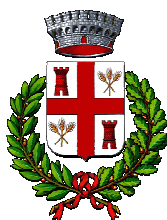
Comune di Francavilla Bisio